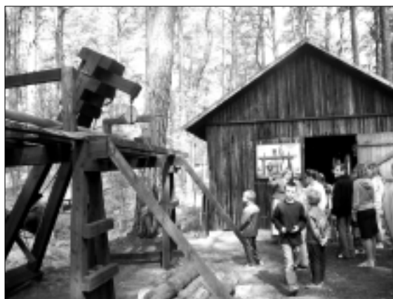
Enkuru un zvejas laivu kolekcija Jūrmalas brīvdabas muzejā.

Laipni lūdzam ikvienu pagasta iedzīvotāju apmeklēt minēto speciālistu lekcijas, kuras turpināsies septembra un oktobra mēnesī. Par lekcijām lūdzam interesēties Olaines pagasta padomes sociālā dienestā vai zvanot pat tālr. 7811295.