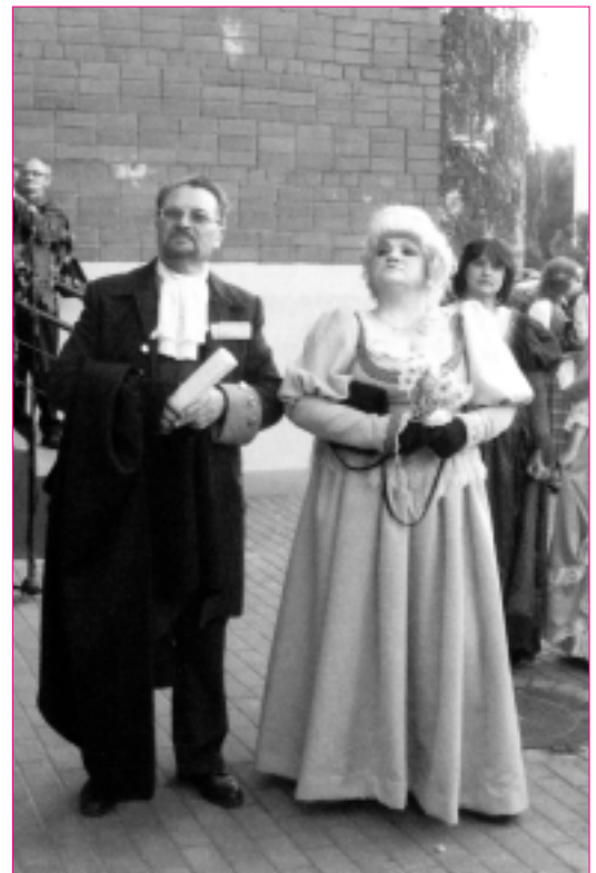
Ķeizarienes sagaidīšana Olainē.

Viktors Melbārdis Olaines pagasta Kultūras nama direktors