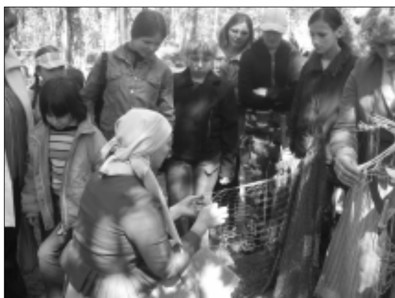
Iemēģinām roku tīkla lāpīšanā.

Lekciju noslēgumā ģimenēm sagādāsim patīkamu pārsteigumu, kas pagaidām tiek turēts noslēpumā.