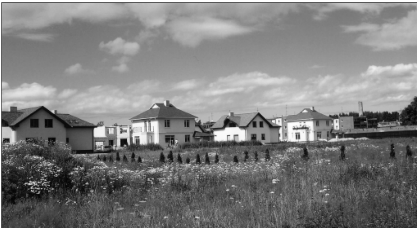
Pagasta jaunbūves.