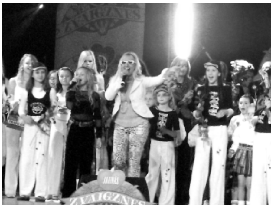
Jauno izpildītāju konkursa Jaunās Zvaigznes noslēgums.

2006.gada maijā Olaines pagasta sociālais dienests izstrādāja projektu ar nosaukumu "Caur izglītību uz pieredzi", kuru finansiāli atbalstīja Bērnu un ģimenes lietu ministrija, projekta realizācijas laiks - no maija līdz oktobrim. Ar šī projekta realizāciju vēlamies dot iespēju ikvienam pagasta iedzīvotājam apmeklēt psihologa, ģimenes ārsta, nepilngadīgo lietu inspektora lekcijas un praktiskās